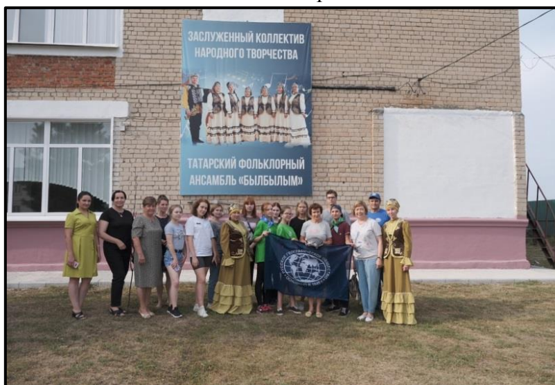
Фото 1. Члены экспедиции с представителями фольклорного коллектива с. Индерка "Быльбылым"

Житель села Индерка бережно хранят традиции своих предков, сохраняют татарскую культуру. К объектам материальной культуры относится: Дом купцов Баишевых, вторая половина 19 в. (памятник архитектуры), мечеть второй половины XIX в. (памятник архитектуры). Богатый материал по истории села и татарской культуре представлен в краеведческом музее средней общеобразовательной школы села Индерка, в библиотечно-досуговом центре. В селе большой популярностью пользуется Заслуженный коллектив народного творчества "Быльбылым", широко известный как в Пензенской области, так и за её пределами (фото 1). Во все времена село развивалось за счет трудолюбия жителей. В советское время в Индерке действовала первая в Пензенской области звероферма колхоза «Искра», которая славилась на всю страну. Звероферма закрылась в 1996 году. В настоящее время в селе экономика представлена земледельческими фермерскими и скотоводческими фермерскими хозяйствами молочного и мясного направления.